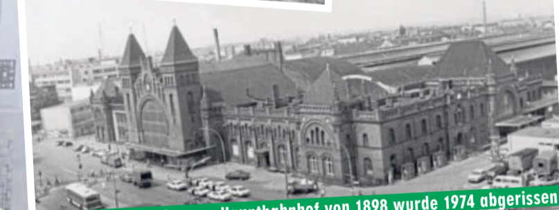
Der preußische Altonaer Hauptbahnhof von 1898 wurde 1974 abgerissen

Altona – Der neue Fernbahnhof Altona ist der fünfte An- und Umbau in 180 Jahren! 1844 war das erste Bahnhofsgebäude (heute Altonaer Rathaus) südlicher Endpunkt der königlich-dänischen Ostseebahn. Der zweite, der preußische Altonaer Hauptbahnhof, wurde Anfang 1898 einen halben Kilometer weiter nördlich eröffnet. 1907 wurde auf elf Gleise erweitert, 1938 kam Altona zu Hamburg, das Gebäude wurde zum „Bahnhof Hamburg-Altona“. Beim dritten Umbau wurden 1974 die historischen Bahnhofshallen abgerissen, durch Betonfertigteile ersetzt. Ab 1979 rollte die S-Bahn (vier Gleise in neuer Station) aus Altona zum Hauptbahnhof.