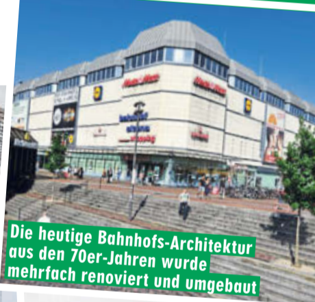
Die heutige Bahnhofs-Architektur aus den 70er-Jahren wurde mehrfach renoviert und umgebaut