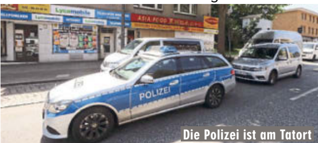
Die Polizei ist am Tatort

Erst Sonntag hatte in einem Park an der Spreestraße (Lurup) ein Obdachloser durch Schläge und Tritte von einem Unbekannten lebensgefährliche Kopfverletzungen erlitten.